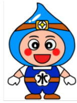
小田原市上下水道局キャラクター 「おみずまる」

ひごろ げすいどうじぎょう りかい きょうりょく 日頃から下水道事業にご理解とご協力をいただきありがとうございます。