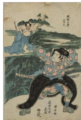
石橋山合戦 佐奈田与一の図 (小田原市郷土文化館)

天正18年（1590）に豊臣秀吉が小田原攻めを開始すると、徳川家康・細川忠興など20万人ともいわれる軍勢が小田原城を囲み、秀吉は石垣山を築城しました。茶人千利休もこの合戦に際し小田原を訪れました。