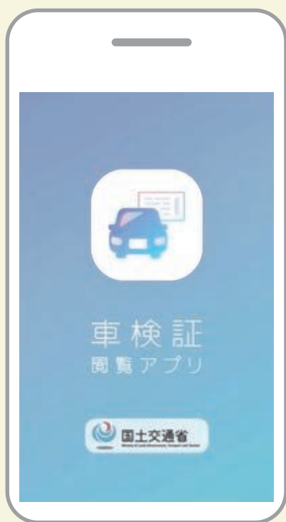
車検証閲覧アプリ