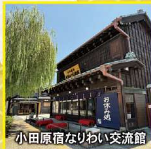
小田原宿なりわい交流館