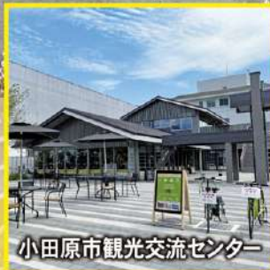
小田原市観光交流センター