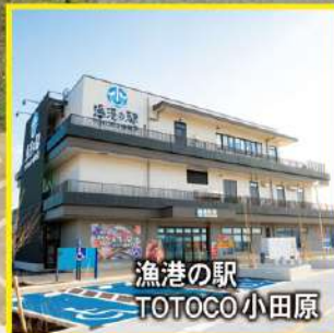
漁港の駅 TOTO CO 小田原