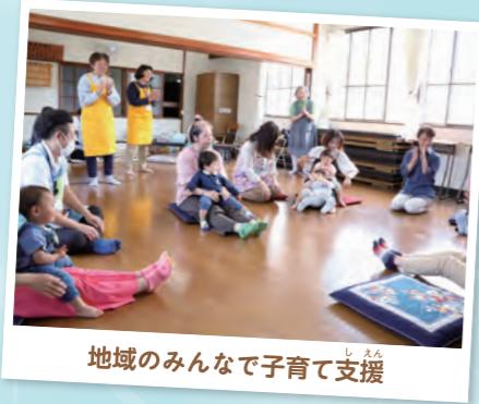
地域の人々で子育て支援