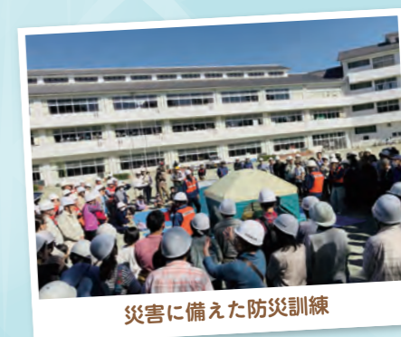
災害に備えた防災訓練