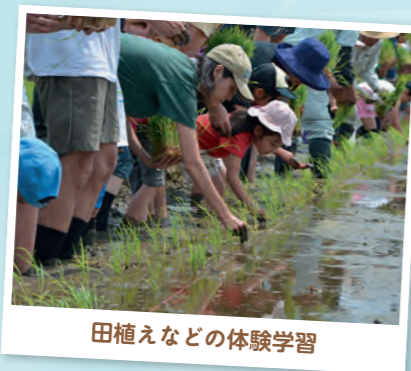
田植えなどの体験学習