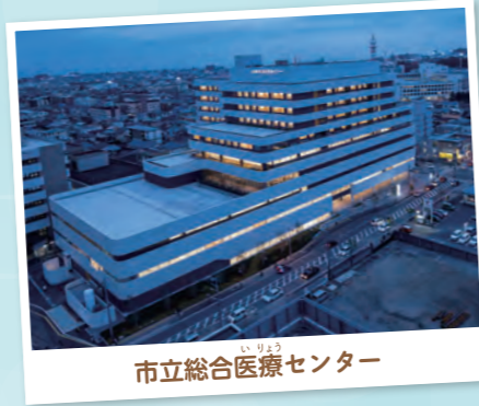
市立総合医療センター