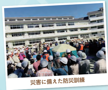
災害に備えた防災訓練