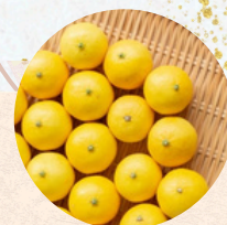
ゴールデンオレンジ

大津みかんと同様、甘みと酸っぱさのバランスがよく風味が濃厚。貯蔵性に優れており、大津みかんと共に小田原みかんのエースです！