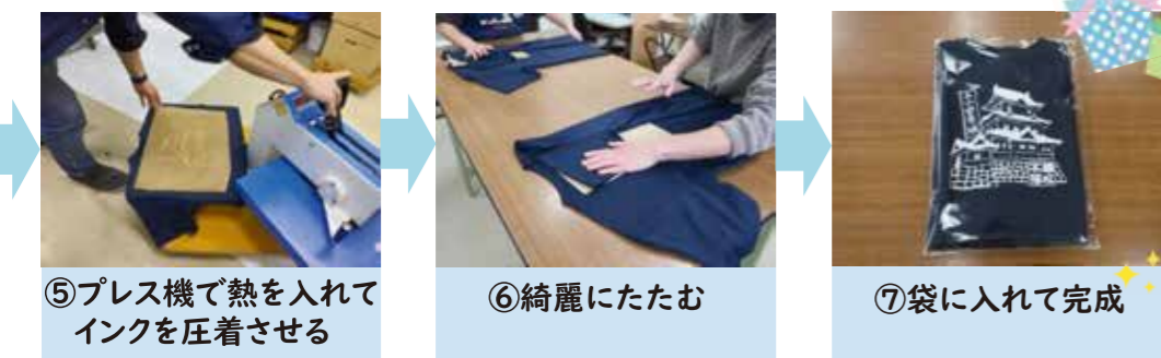
⑤プレス機で熱を入れてインクを圧着させる ⑥綺麗にたたむ ⑦袋に入れて完成

①から④は職員さん、 ⑤から⑦は利用者さんが作業されて、注文される皆さんの元へ届けられます♪