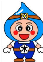
小田原市上下水道局キャラクター 「おみずまる」

ひごろ げすいどうじぎょう りかい きょうりょく 日頃から下水道事業にご理解とご協力をいただきありがとうございます。