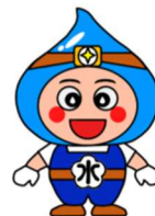
小田原市上下水道局キャラクター 「おみずまる」

ひごろ げすいどうじぎょう りかい きょうりょく 日頃から下水道事業にご理解とご協力をいただきありがとうございます。