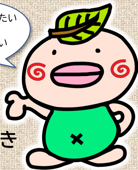
けやきのキャラクター「けやきん」