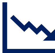
売上や利益の減少