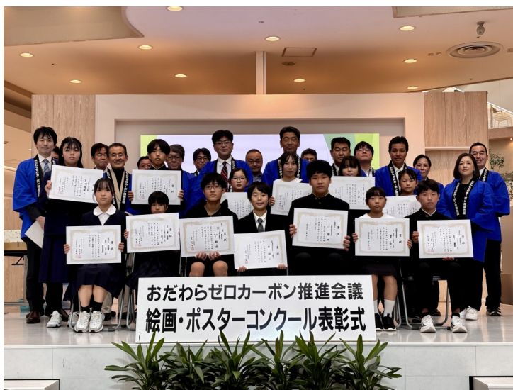
<第14回 絵画・ポスターコンクール表彰式の様子>