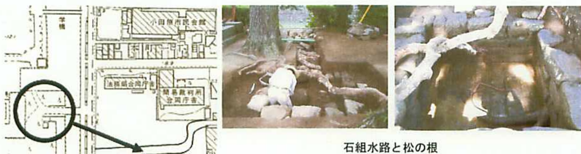
石組水路と松の根